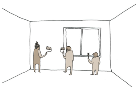
Poursuite en autonomie avec les outils et conseils des Compagnons.