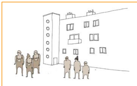
Prise de contact.

Depuis 2014, les Compagnons-Bâtitisseurs sont présents à Narbonne.