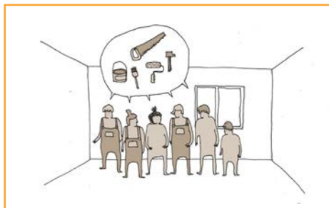
Elaboration du projet avec l'habitant.