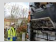
Collecte des conteneurs