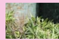
Exemple de déchets verts

ENCOMBRANTS FERRAILLES DÉCHETS VERTS CARTONS GRAVATS BOIS