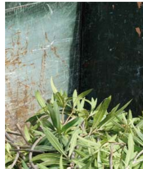
Les déchets verts des particuliers sont acceptés