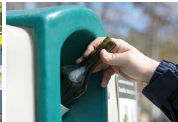
Colonnes vertes : pour le verre