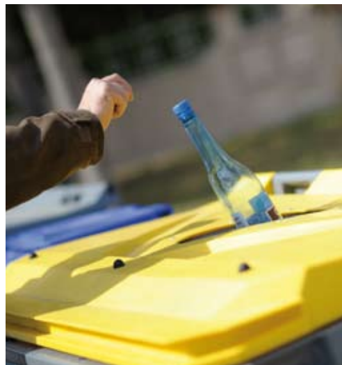
Conteneurs ou colonnes jaunes : pour tous les emballages

Des conteneurs et colonnes, jaunes, bleus, verts pour collecter les emballages, ménagers (plastique, cartonnés, aluminium...), les papiers, journaux et magazines et le verre.