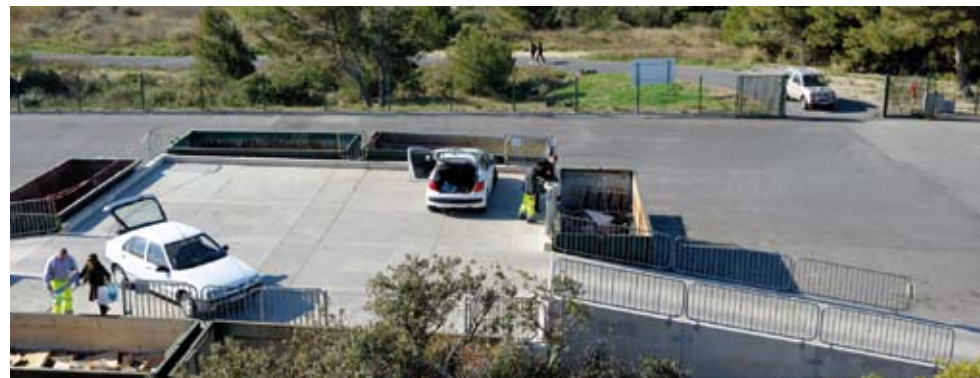
Déchetterie de Saint-Pierre-la-Mer