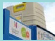
Collecte des colonnes