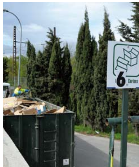
Les cartons sont à déposer en déchetterie uniquement