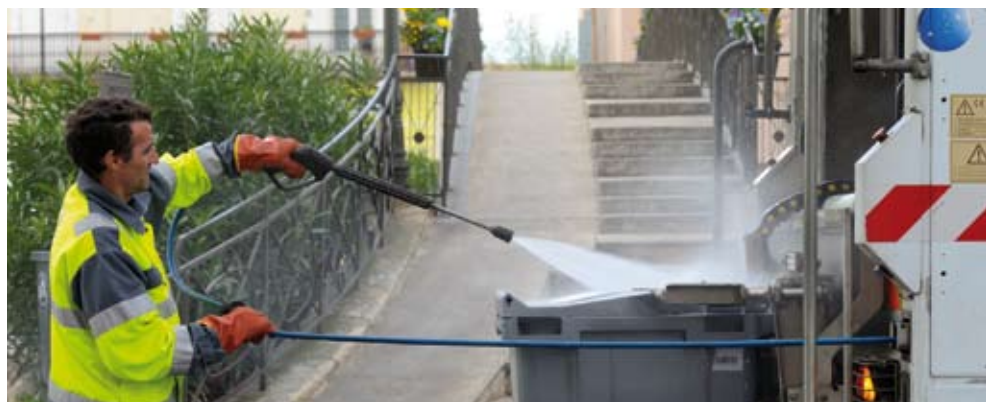
Les conteneurs et les colonnes des 29 communes sont lavés 4 fois par an par les agents du service environnement du Grand Narbonne.

→ Les agents de collecte ne sont pas habilités à ramasser les papiers usagers sur la voie publique... Pensez à garder votre environnement propre !