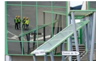
Centre de tri de Lambert