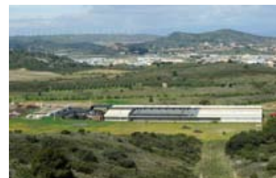
La plateforme de Bioterra