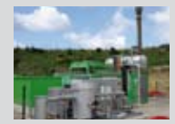
Valorisation du biogaz en production d'électricité

Conteneurs et colonnes près de chez vous