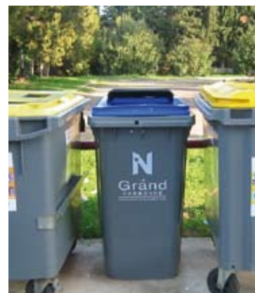
Point de tri sélectif à Narbonne