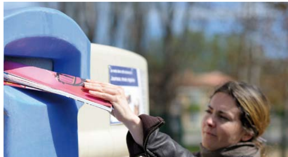
Conteneurs ou colonnes bleus : pour le papier, journaux, magazines