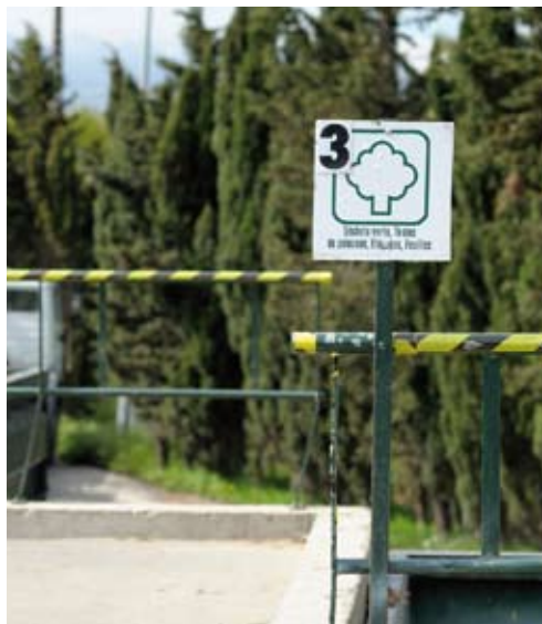
Les particuliers peuvent déposer en déchetterie jusqu'à 1 m 3 de déchets par semaine

Les déchetteries communautaires vous permettent de trier et de valoriser les déchets qui ne sont pas pris en charge par la collecte traditionnelle des ordures ménagères. Réservées aux particuliers, elles acceptent jusqu'à 1m 3 de déchets par semaine. Les déchets verts et encombrants en font partie.